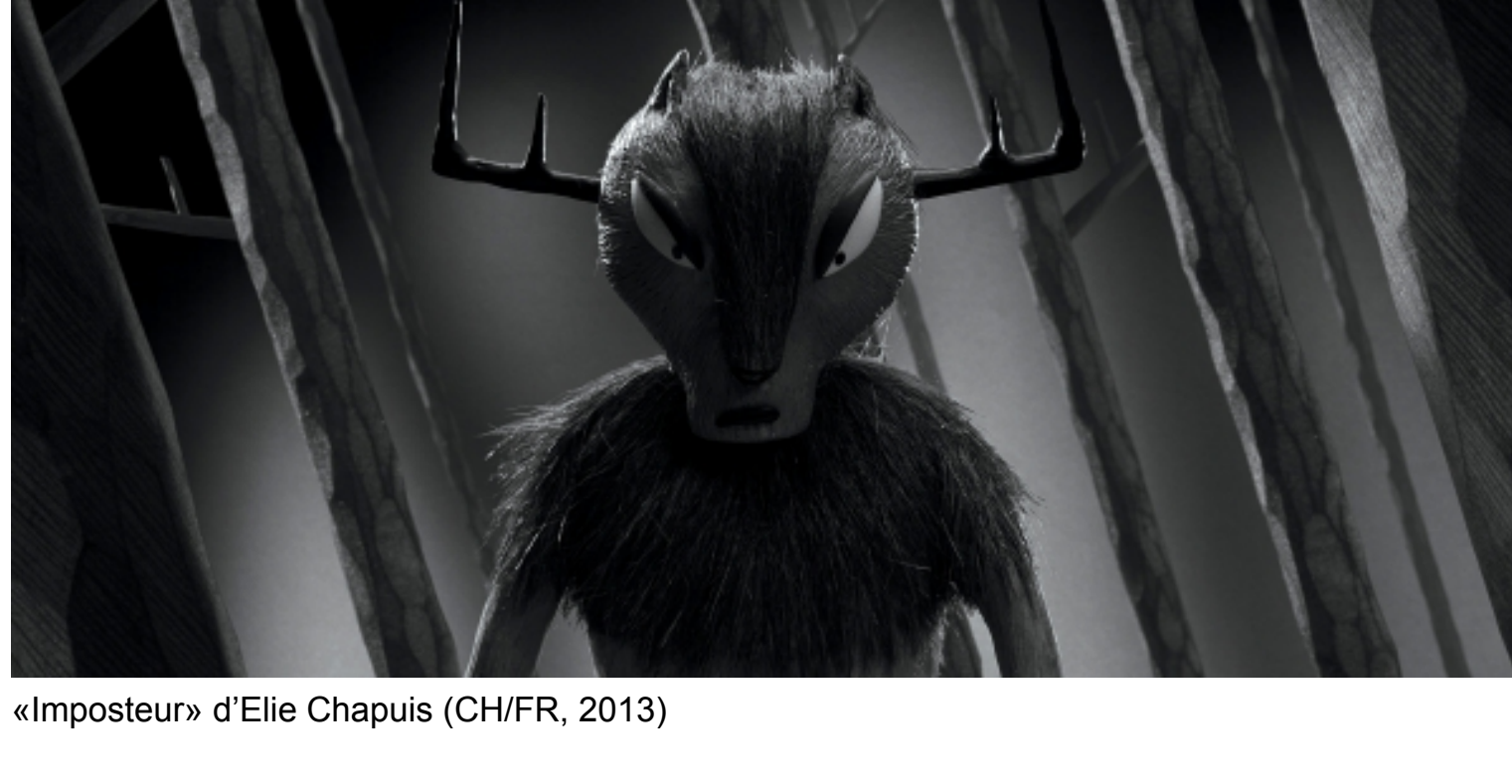
«Imposteur» d'Elie Chapuis (CH/FR, 2013)

Entre-temps, nous vous adressons de cordiales salutations et vous souhaitons une lecture intéressante!