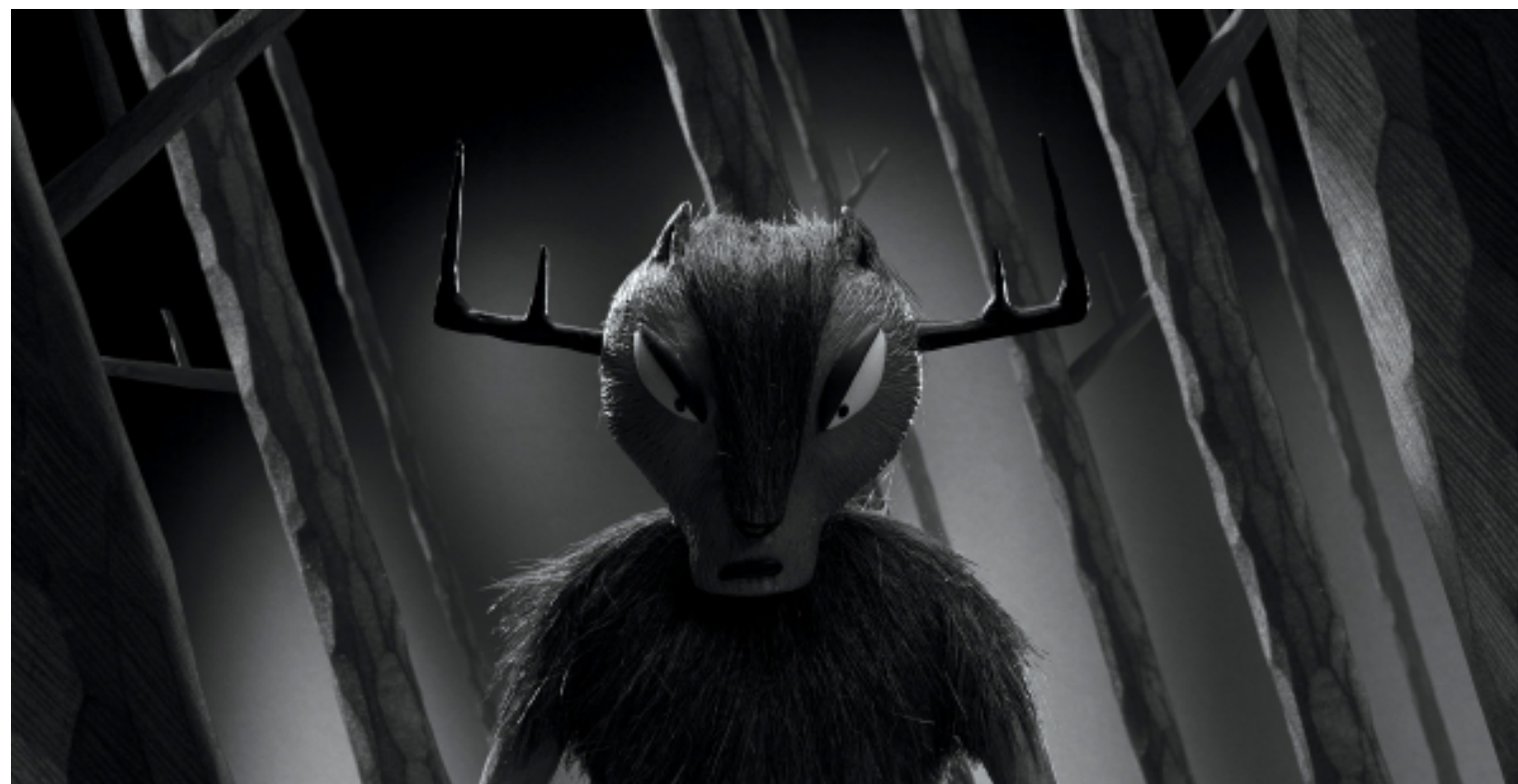
«Imposteur» von Elie Chapuis (CH/FR, 2013)

In der Zwischenzeit wünschen wir Euch eine informative Lektüre und eine schöne Zeit!