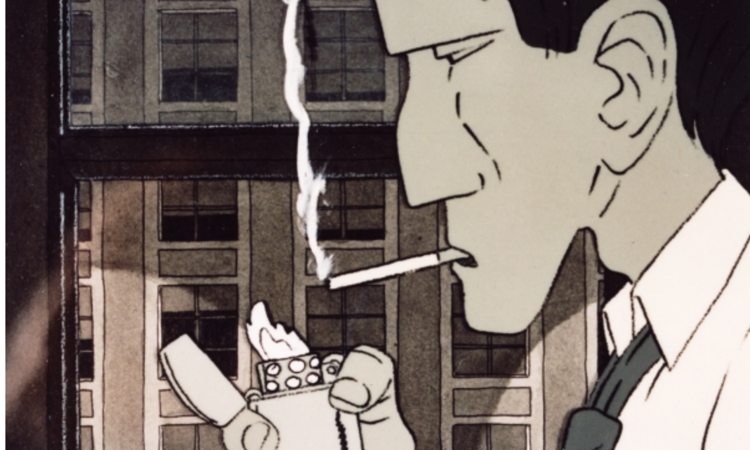
«Poker Blues» von Antoine Guex (CH, 1992)

Zu diesem Anlass zeigt das stattkino Luzern in Zusammenarbeit mit Kilian Dellers ein Programm erlesener Animationsfilme aus der Schweiz .