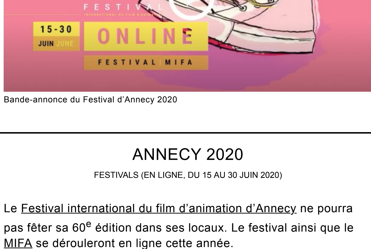
Bande-annonce du Festival d'Annecy 2020