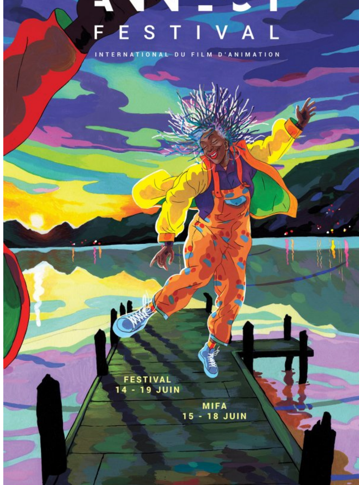
Affiche Anecy 2021, illustration: Jean-Charles Mbotti-Malolo

Au plaisir de vous revoir bientôt personnellement!